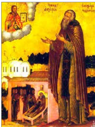
Илл. 1. Прп. Елеазар Анзерский. Икона. Первая половина XVIII в.

В круг святых и подвижников благочестия на Руси архим. Леонид (Кавелин) включил прп. Елеазара Анзерского († 1656) 1 , который уже в начале XVIII в. имел общерусское почитание 2 и св. изображения, созданные в традиции севернорусской иконографии 3 . (Илл. 1)