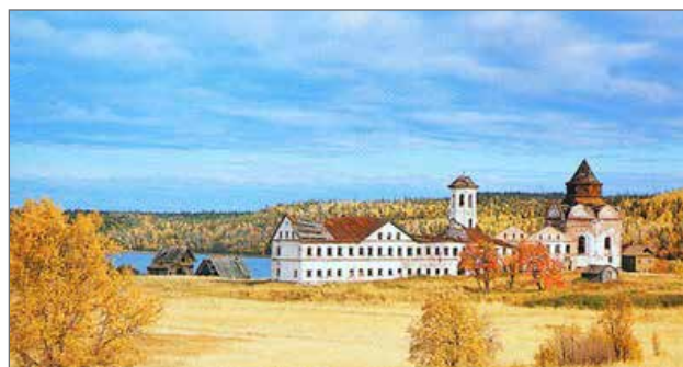
Илл. 2. Свято-Троицкий Анзерский скит. Современный вид

Источник архим. Леонида о прп. Елеазаре Анзерском. (Илл. 2)