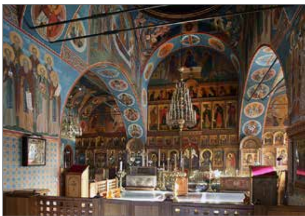
Илл. 4. Центральная арка Казанской церкви. 2012 г.

Казанский храм, возводившийся в первое десятилетие XIX в. во Введенской Оптиной пустыни, отличался от других монастырских церквей богатством иконной и стенной живописи (с. 183, 184). Оригинальные св. изображения внутри собора не сохранились. Не описаны они и архим. Леонидом. Однако образ прп. Елеазара воспроизведен монастырскими иконописцами в 2000-х гг. на северной стене центральной арки на фреске, выполненной по древнему способу «влажной» росписи. (Илл. 4.).